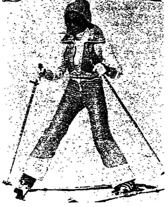
الملكة الزينة عالية في المنتجع السويسري